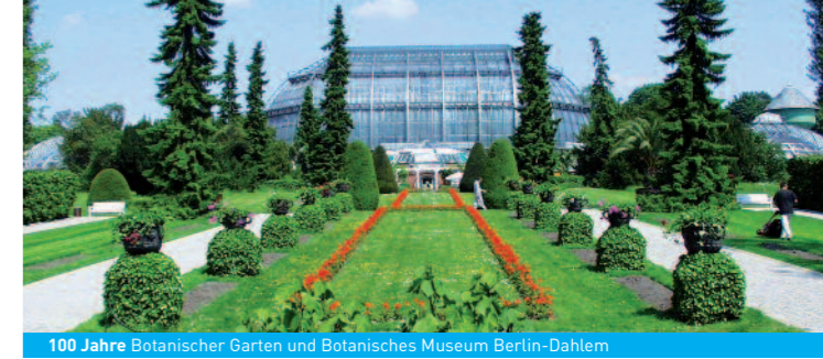
100 Jahre Botanischer Garten und Botanisches Museum Berlin-Dahlem

200.000 Menschen studieren, lehren und forschen in Berlin