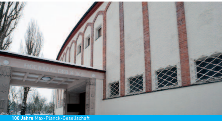
100 Jahre Max-Planck-Gesellschaft