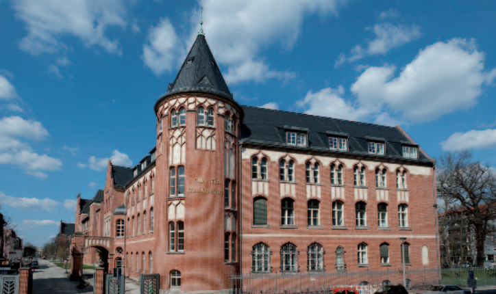
300 Jahre Charité – Universitätsmedizin in Berlin