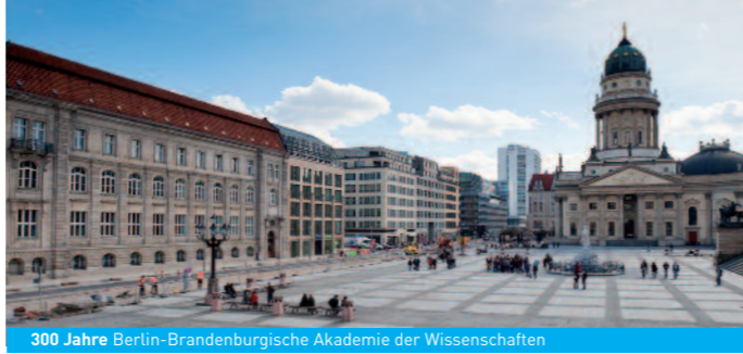
300 Jahre Berlin-Brandenburgische Akademie der Wissenschaften