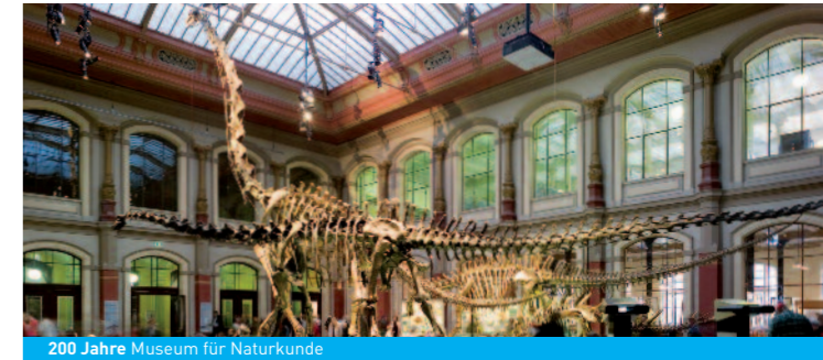
200 Jahre Museum für Naturkunde