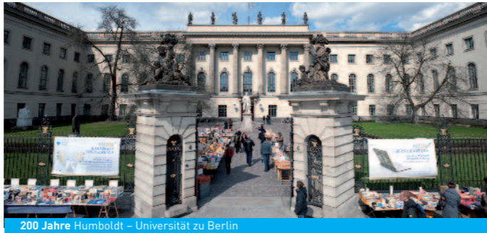
200 Jahre Humboldt – Universität zu Berlin