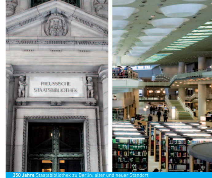
350 Jahre Staatsbibliothek zu Berlin: alter und neuer Standort